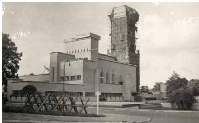
1943: het Hilversums raadhuis met gecamoufleerde toren