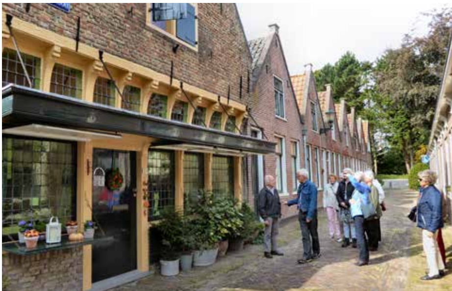
Alkmaar vorig jaar

Senver organiseert stadswandelingen in het zomerseizoen, van april tot en met oktober. Vanwege de zomerschool niet in juli en augustus. Wat gaan we dit jaar doen op de derde donderdag van de maand?