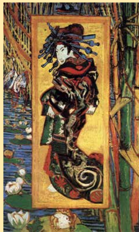
Courtisane (naar Eisen), 1887

Kosten Senver-leden € 3,00. Niet-leden € 4,00. Dat is inclusief koffie/thee in de pauze.