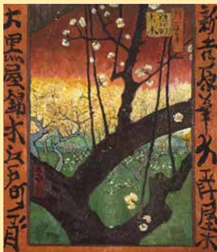
Van Gogh, Bloeiende pruimenboom (naar Hiroshige), 1887