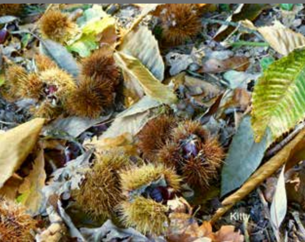
Gemaakt door Kitty Dehu