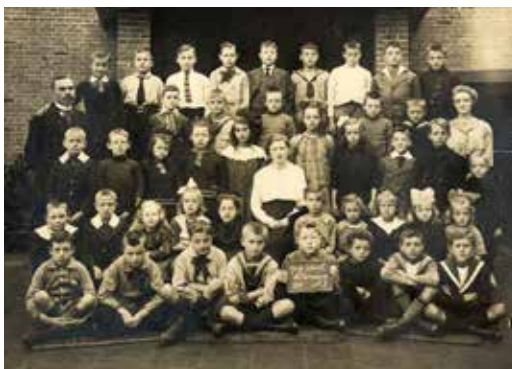
Klassenfoto van de Gereformeerde School uit 1921

Data maandagmiddag 18 december Tijd 15.00 uur Plaats de theaterzaal van de Bibliotheek, 's-Gravelandseweg 55 in Hilversum Kosten € 3,00 voor Senver-leden en € 4,00 voor niet-leden. Aanmelden bij Marina Slootheer, marina.slootheer@kpnmail.nl of 035-6284823.