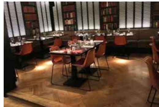
Kerstdiner in restaurant Rex