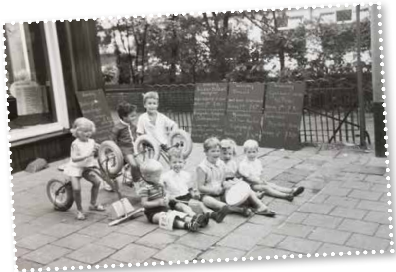
Foto van kinderen van de Groest

Wonend in dit stukje speelden de kinderen van café Bus op het hoekje vaak in ons grote huis. Naast het café, dus richting Kerkstraat, was een brede gang, waar later een tapijtzaak zich vestigde en nu een biercafé zit. Die gang ging naar de bewoners boven de Brilmij (er zit nog steeds een brillenwinkel). Die zaak zat onder één dak met postzegelhandel Gosse. Beide gezinnen hadden twee kinderen, die ook regelmatig bij ons speelden.