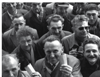
Erfgooiers staan met stembiljetten klaar voor een algemene ledenvergadering van 'Stad en Lande van Gooiland' op het Hilversums sportpark, ca. 1962.

De Senver-historielezing op 15 januari gaat over de erfgooiers. De erfgooiers: Gooise boeren en veehouders die gezamenlijk gebruiksrechten hadden op gemeenschappelijke gronden als weilanden of 'meenten', heiden, bossen, venen, moerassen en jachtvelden.