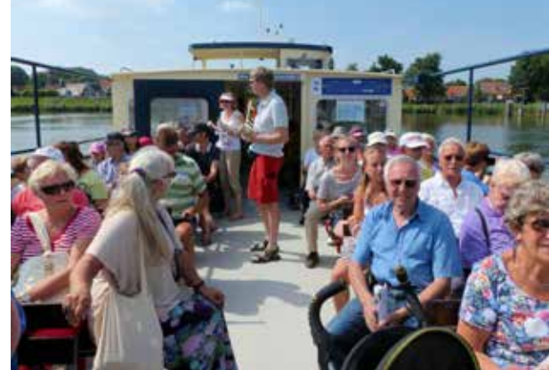
Vaartocht tijdens Zomerschool vorig jaar.

of ze meekunnen. Bijna alle aanmeldingen kunnen gehonoreerd worden, maar bij de excursies naar Bedrijvig Nederland en het Jopie Huisman museum gaan we één dag in plaats van twee. Voor de dagtocht naar de Heilig Landstichting hebben we helaas niet het minimaal nodig aantal aanmeldingen gekregen. Alle betrokkenen krijgen hierover nog nader bericht.