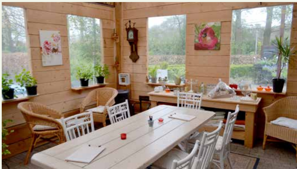
Interieur van een deel van de winkel.

Dat geldt ook voor de grote moestuin van het een hectare omvattende gebied. Je kunt er voor 310 euro per jaar - van