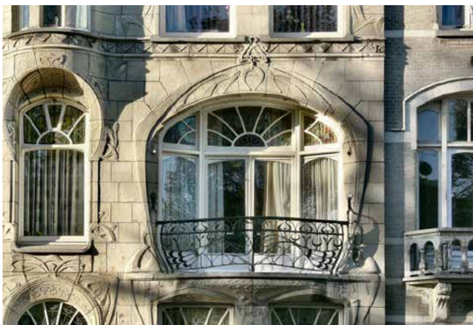
Detail woning Laan van Meerdervoort