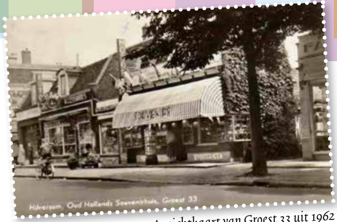
Ansichtkaart van Groest 33 uit 1962

'Sage Femme' gaat 22 juni officieel uit in Nederland maar is dinsdag 13 juni alvast te zien speciaal voor SENVER leden.