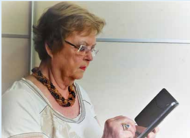
Henja met haar smartphone waarop ze de mantelzorg-app geïnstalleerd heeft.

Ik doe het bedlampje aan en pak mijn mobiel. Mijn oog valt op de familie appgroep. Daar kletsen we wat op af. Heel gezellig. En dan, IDEE, een Mantelzorg groepsapp. Uitsluitend om hulp te vragen, niet om te kletsen. Ik maak een groepsapp aan, noem hem 'mantelzorg app', dan weet iedereen wat de bedoeling is en vul de telefoonnummers van alle kinderen en kleinkinderen in met de mededeling dat deze groepsapp alleen gebruikt wordt voor hulp vragen en wie niet mee wil doen kan zichzelf uitschrijven. 'En dan komt nu de eerste vraag: wie kan de batterij van het brandalarm vervangen, hij piept.' Vervolgens ga ik rustig slapen.