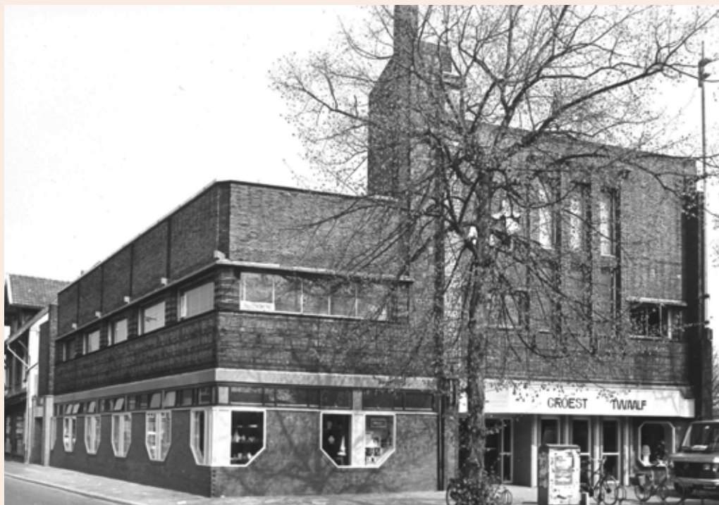
Het oude theater Achterom aan de Groest

Filmkring die niet meer actief was nog wel statuten had en een girorekening en dat deze nieuwe filmactiviteit ondergebracht kon worden in deze slapende stichting, bovendien konden ze terecht in Theater Achterom die toen nog aan het Langgewenst was gevestigd. Ik kwam er in 1981 bij als penningmeester,