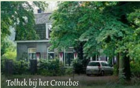
Tolhek bij het Cronebos

Op woensdagmiddag 14 juni gaat de wandeling naar het Hoge Erf nabij Lage Vuursche. Het vertrek is om 13.30 uur bij restaurant Groot Kievitsdal.