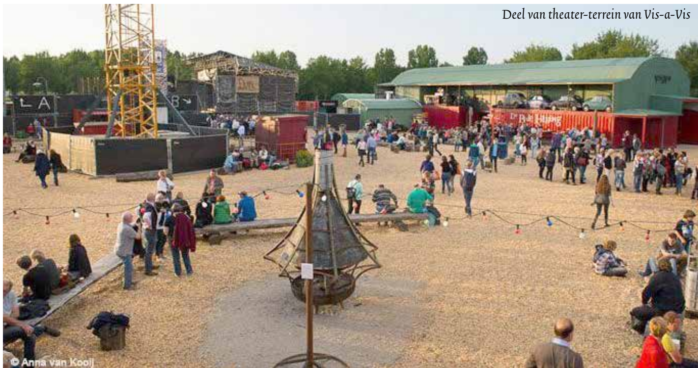
Deel van theater-terrein van Vis-a-Vis