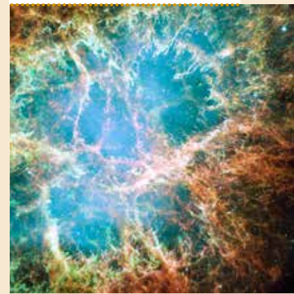
Restanten van een ontplofte ster

Datum maandag 5 maart Tijd 15.00 tot 17.00 uur Plaats Sociëteit De Unie, 's-Gravelandseweg 57, Hilversum Kosten € 3,00 voor Senver-leden, € 4,00 voor niet-leden. Na afloop kan in de sociëteit gegeten worden voor € 16,95.