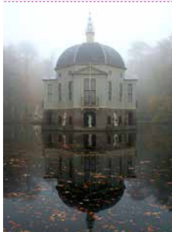
Schaep en Burgh, één van de fraaie buitenplaatsen

Kosten € 3,00 voor Senver-leden, € 4,00 voor niet-leden