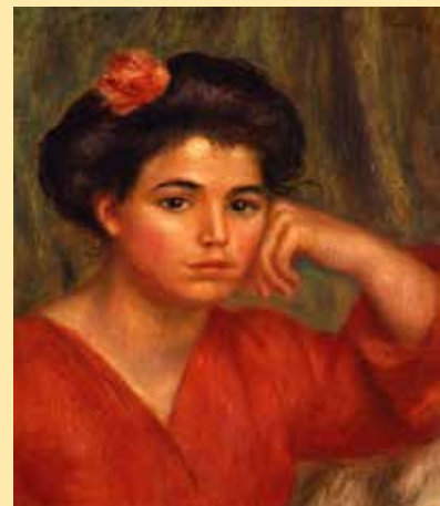
Renoir, Jonge vrouw met roos

Datum Woensdag 21 maart Tijd Ophalen tussen 12.00 en 13.00 uur en ca. 18.00 uur thuis Kosten Voor Senverleden € 8,00. Niet-leden € 10,00. Toegang € 15,00. Met Museumkaart alleen € 3,00 toeslag.