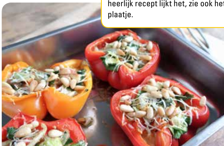
Gevulde paprika's op Italiaanse wijze, van www.eatpurelove.nl

Glenn van Kopenhagen raadt aan om eens op internet bij 'De Hippe Vegetariër' te kijken. Ze raadt ook een recept van gevulde paprika's, op z'n Italiaans aan dat te vinden is op www.eatpurelove.nl (type dan in het zoekvakje 'gevulde paprika'). Een heerlijk recept lijkt het, zie ook het plaatje.