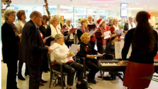
Met z'n allen popsongs en evergreens zingen