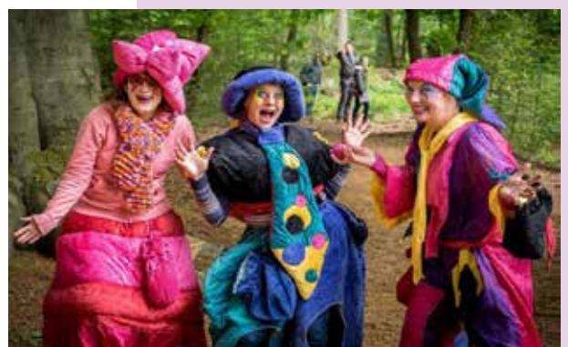
Vuurool, verrassende optredens in de natuur

Stuur dan een e-mail aan cultuurkring@senver.nl