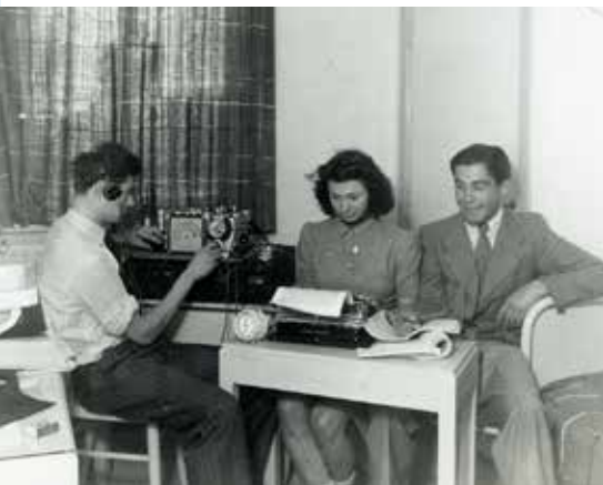
Illegale communicatie tijdens de oorlog

Senver en Museum Hilversum bieden op maandag 30 april een ontvangst en lezing over de tentoonstelling 'Terug naar 1940-1945', over Hilversum tijdens de Tweede Wereldoorlog.