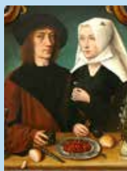
7 Museumlezing Portretten uit Vlaanderen