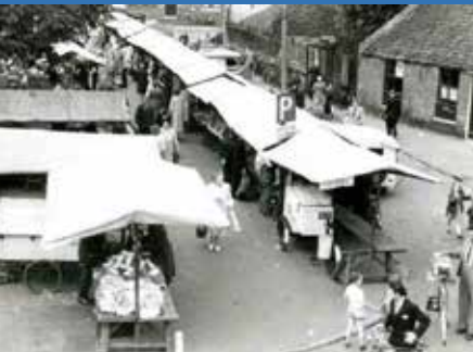
De markt op het Langgewenst in Hilversum in de jaren 60

Hebt u een herinnering om te vermelden? Stuur deze aan redactie@senver.nl Of bel Ineke van de Rotte, redacteur van dit blad, tel. 035-6241880.