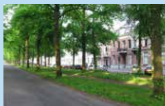
8 NS-wandeling van Bilthoven naar Utrecht