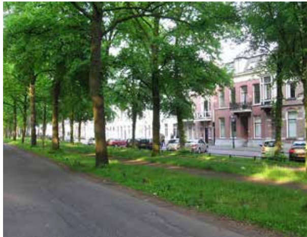
Fietspad langs de Maliebaan

Op de eerste donderdag van november gaat de lange wandeling van NS station Bilthoven naar Utrecht centraal. De wandeling in herfstkleuren voert ons van het station Bilthoven via wegen, lanen, paden, oude vestingwerken, stadsparken en oude straatjes naar Utrecht. In de buitenwijken van Utrecht aangekomen, lopen we via de Maliebaan naar het station. De maliebaan was vroeger een kaatsbaan. Langs de maliebaan loopt het eerste en oudste fietspad van Nederland. Aan het eind van deze straat hebben we de keus om via de oude binnenstad of via