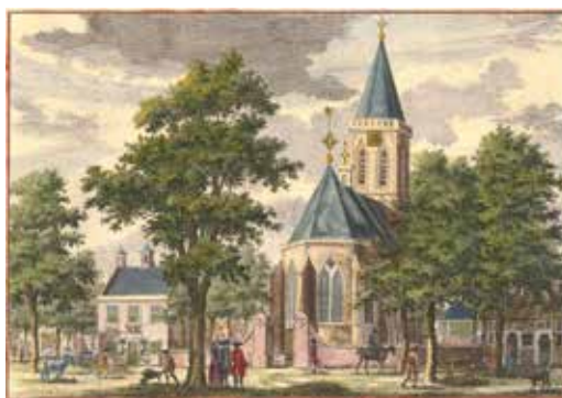
Grote Kerk op de Kerkbrink