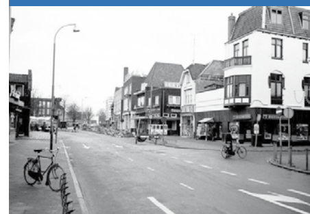
De Groest omstreeks 1970 rechts Leeuwenstraat

Dat kan bij Marina Slootheer, marina.slootheer@kpnmail.nl of 035-6284823.