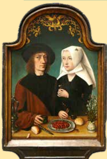
Hendrik van Wueluwe, Zelfportret met echtgenote, 1496