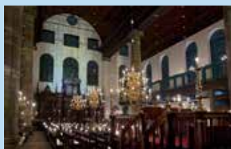
5 Naar Kaarslichtconcert Portugese Synagoge