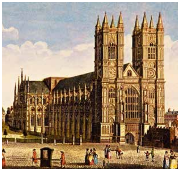
Westminster Abbey in Londen

Engelse tv-series over koningen en koninginnen zoals Hendrik VIII en Elisabeth I mogen zich verheugen in een grote belangstelling. Maar welke muziek werd gemaakt aan hun hoven en in hun kerken? Dat is de vraag van de opening van het nieuwe seizoen van de Senver-muziekochtenden. Roerige tijden waren het: dan weer klonken er Anglicaanse anthems en dan weer katholieke missen in de kerken. Soms werd instrumentale muziek verboden in kerken, maar dan kwam er een opleving van instrumentale huismuziek. De Engelse muziek van die tijd was zeer toonaangevend in heel Europa en nog steeds wordt deze muziek zo zeer gewaardeerd dat bijvoorbeeld van John Dowland veel melancholische liederen in een modern jasje zijn gestoken. Dat en nog meer zit in de Klassieke Muziekochtend van oktober.