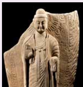
Chinese boeddha, ca. 600

15 en 16 januari Het leven van Boeddha Nieuwe kerk Amsterdam