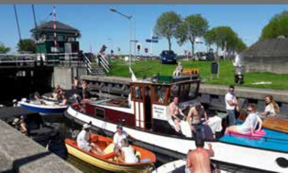
Zomerfoto uit augustus van Sluis het Hemeltje, gemaakt door Mariëtte Koopman