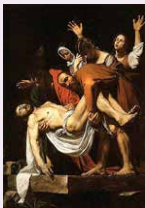
De graflegging van Christus, Caravaggio, 1603

11 en 12 december Caravaggio en Europa Centraal Museum Utrecht