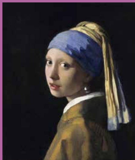
Vermeer: Het meisje met de parel

Aanmelden Tot uiterlijk 8 oktober bij René van Helmond, liefst per email aan R.van.Helmond2@kpnplanet.nl , met uw telefoonnummer. Of bel vanaf 1 oktober 06-44608126, eventueel inspreken en naam en telefoonnummer vermelden. Bij meer dan 40 aanmeldingen wordt geloot. Als u op 11 oktober nog niets hebt gehoord, kunt u mee.