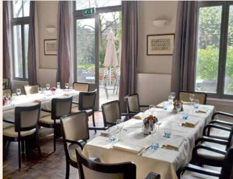
Het is stijlvol dineren in De Unie

Op mijn vraag wat het verschil is tussen buitengewoon en gewoon lid legt Martin uit: "een buitengewoon lid, man of vrouw, mag alleen op afgesproken uren naar binnen, zoals ook jullie van Senver. Een lid, altijd een man, mag altijd naar binnen en kan deelnemen aan alle activiteiten en diners. Leden komen hier om koffie te drinken of te biljarten, bridgen, schaken, kegelen.' Het lidmaatschap kost € 380 per jaar en € 190 eenmalig entreegeld. Maar de inmiddels 400 leden hebben de inkomsten van de 770 buitengewone leden heel hard nodig, want het is een duur gebouw om te onderhouden en te verwarmen en er werken vijf fulltime personeelsleden, twee in deeltijd, twaalf oproepkrachten en twee stagiaires. Het is hard werken heb ik gezien, soms zitten alle zalen vol met eters, drinkers aan de bar, biljarters, maar Martin vindt het heerlijk: 'Geen dag is hetzelfde, wij hebben zoveel leuke terugkerende evenementen, het Heerendiner, stampotterie, filmavonden, vader/dochter diners, de poëziemiddagen, haring- en asperge-avonden. Soms hebben we wel 250 man binnen. Ik ben trots op De Unie'.